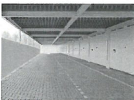
Beispiel für halboffene, mit Terrassen überdeckte Garage nach Kempe Till Architekten, Niederlande