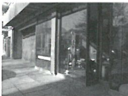
Beispiel für in die Straßenfassade integrierte Parkpalette mit potenzieller Umnutzungsmöglichkeit, Architekt W. Popp, Berlin