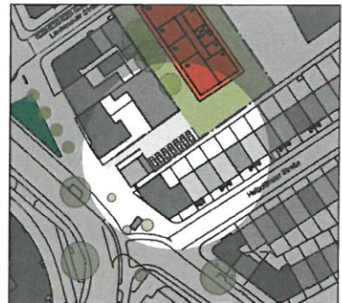
Parkpaletten in Einhausung