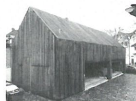
Beispiel für überbaute Parkpaletten, Köln